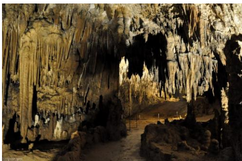
Škocjanske jame – zadnji del Velike dvorane

Že malce lačni in zelo utrujeni, vendar polni lepih vtisov, smo se napotili še do naše zadnje točke; to je kmetija Hudičevce. Ime je strašljivo, a hrana zelo okusna in pridelana na tej ali pa na kateri izmed okoliških