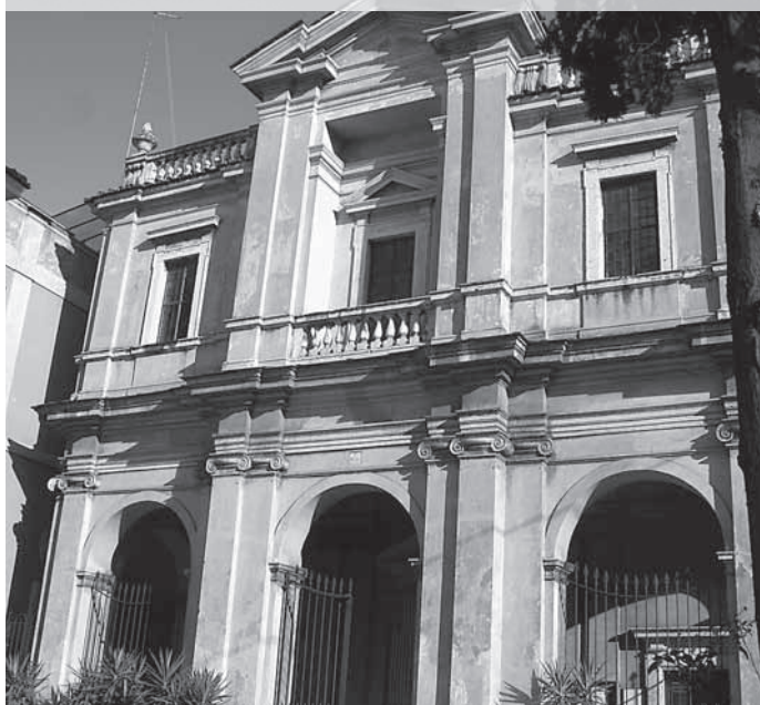
Cerkev, kjer počiva telo svete Bibijane