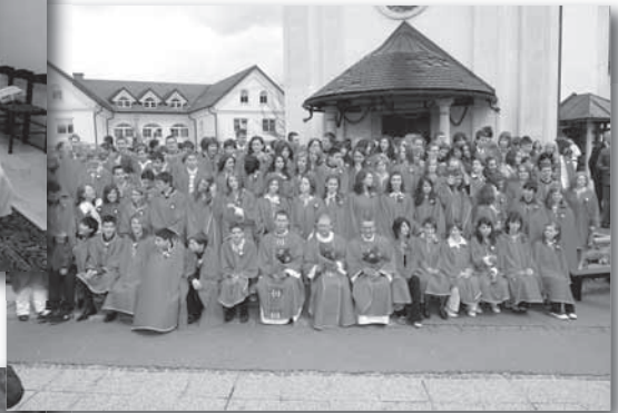
Število birmancev, ki so prejeli zakrament sv. birme, je v letošnjem letu 102.