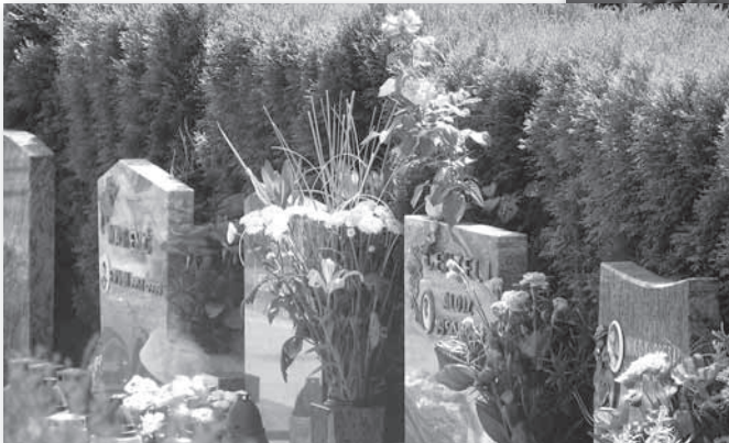
Do septembra je bilo s cerkvenim obredom v večnost spremljanih 18 pokojnikov. Najstarejši je dopolnil 96, najmlajši pa 57 let.