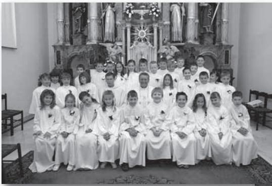
Prvo obhajilo je prejelo 45 otrok.