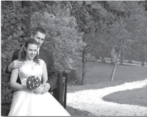
Pred Bogom je sklenilo sv. zakon 9 parov.