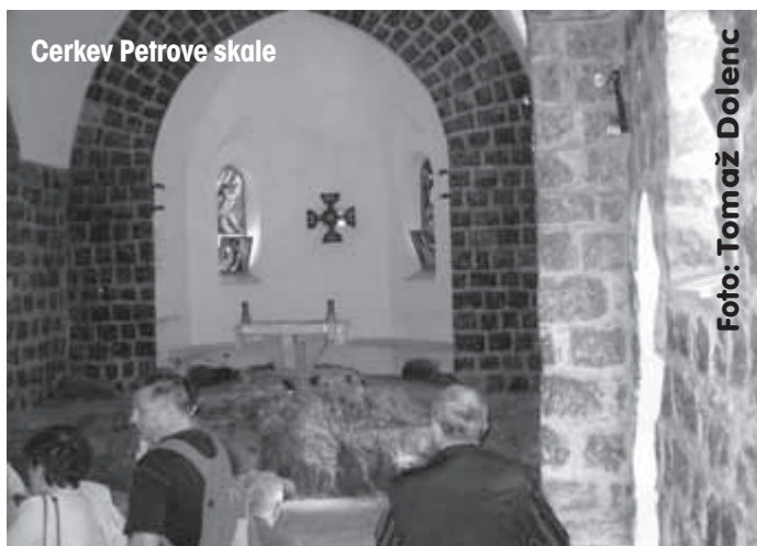
Cerkev Petrove skale

rom, na kateri stoji čudovito lepa cerkvica s kupolo – Gora blagrov. Na gori se razprostira zelo lep park s prečudovitim zelenjem in cvetjem. V njem je med starodavnimi oljkami postavljenih več oltarjev na prostem, kjer se za posamezne skupino lahko darujejo sv. maše kar na prostem in ne samo v cerkvi. Tudi mi smo v tem zelenem gaju imeli sv. mašo.