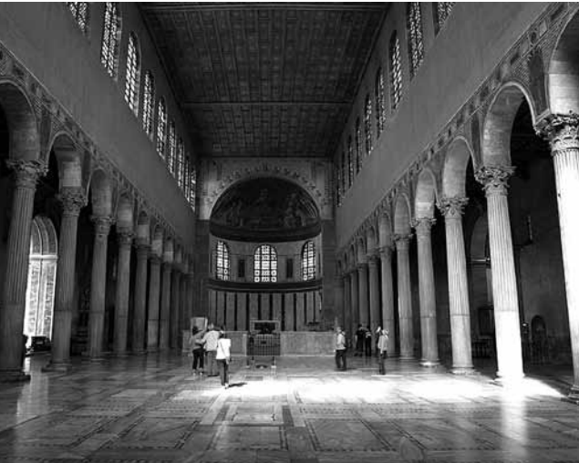
Bazilika svete Sabine v Rimu

Sveta Sabina je bila rimska mučenica. Bila je poročena s senatorjem