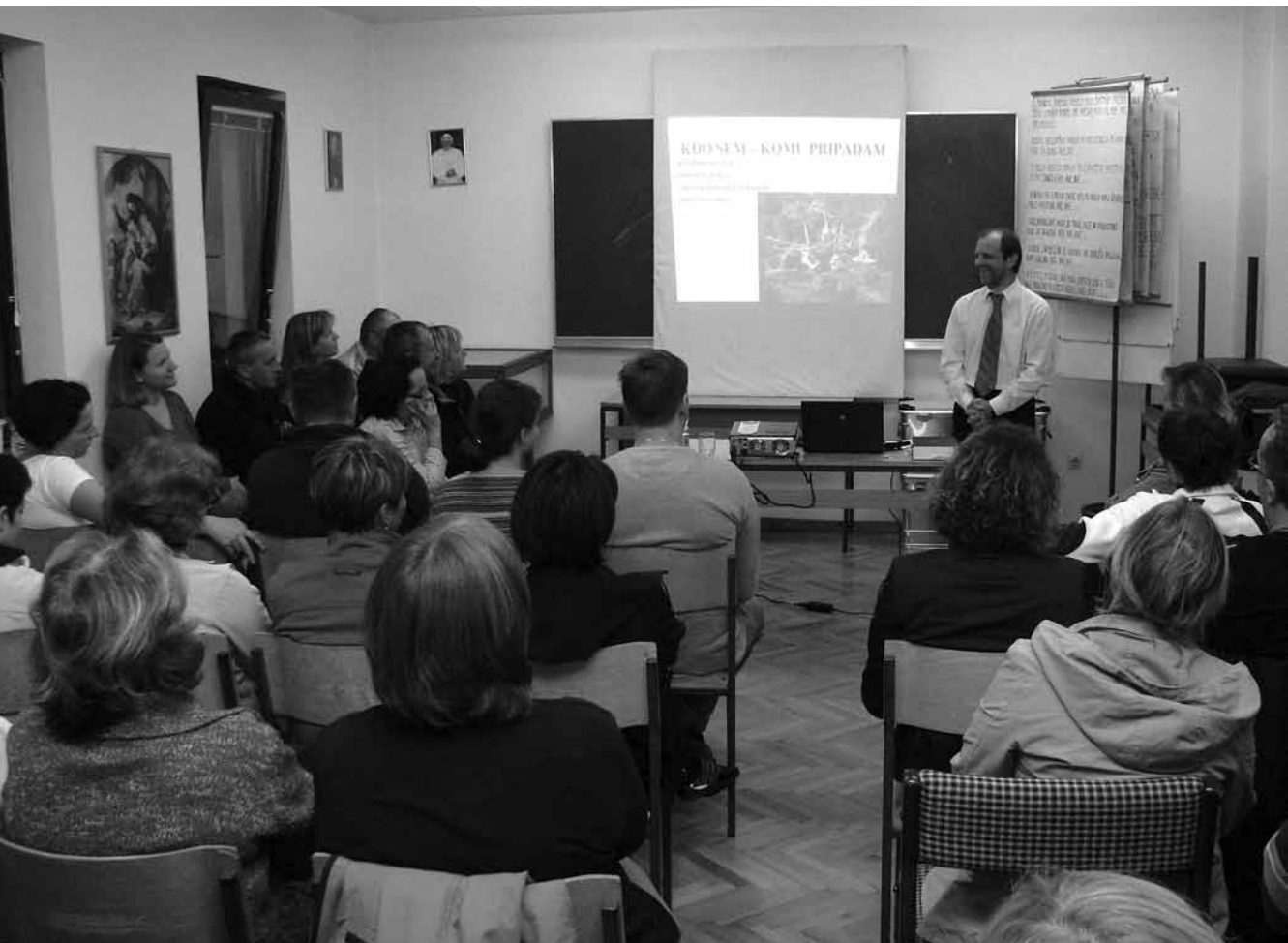
Utrinek iz prvega predavanja.

Potem smo poslušali o očaku Abrahamu. Sveto pismo predstavi Abrahama v prvi vrsti kot vzor vere, dr. Gerjolj pa nam ga je orisal tudi kot konkretnega zakonskega moža in očeta, ki mu življenje prav nič ne