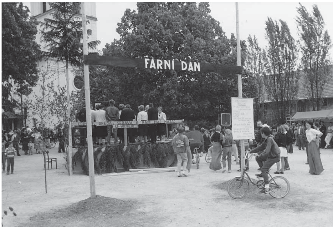
Prvi farni dan leta 1991

Pripravljalni odbor praznovanja farnega dne