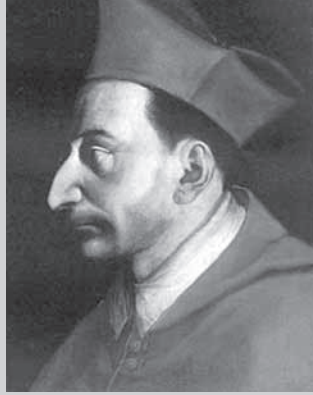
KAREL BAROMEJSKI, milanski nadškof (1538-1584)