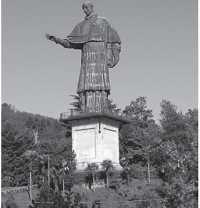
Kip v Aroni - Italija