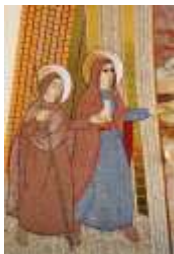
Sv. Angela Merici