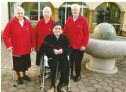
darilo koprške škofije - rdeče jakne.

Je kuharica s Poljan na sliki, ni važno, kdo smo in od kod, da le ljubimo Njegovo pot.