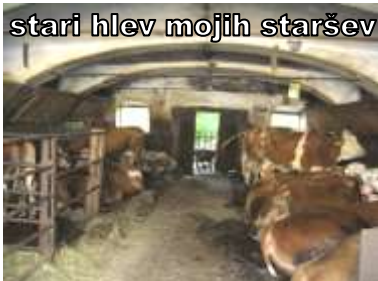
stari hlev mojlih staršev

Večina ljudi se vsako leto poigrava z načrtovanjem počitnic. Tudi domski delavci nismo izjema. Za glavnino zaposlenih v domu se je čas dopustov že zaključil. Nekateri so ga preživeli na morju, v toplicah, hribih, jezerih, rekah. Nekateri so odšli k sorodnikom, drugi so obiskali daljne kraje, dežele. Peščica pa je ostala doma. Ko boste razmišljali, kje preživeti počitnice, ne pozabite naslednje leto na naše podeželje, na naše kmetije. Zelo malo je kmetij, ki si privoščijo morsko obarvane počitnice. Nekje je problem denar, nekje premalo delovne sile na kmetiji. Ampak tudi na deželi, v naravi, je lahko lepo. Zato vas povabim, da vsaj kdaj naredite spremembo in pojdite daleč stran od hrupa, množic in vsakdanjega življenja. Pojdite na delavne, aktivne počitnice na slovensko podeželje. Veliko je kvalitetnih turističnih kmetij, ki ponujajo izjemne storitve. Vaše družine popeljejo v čas naših očetov, dedkov, babic. V čas brez tehnologije, v čas krušnih peči, sveč, tople domačnosti.