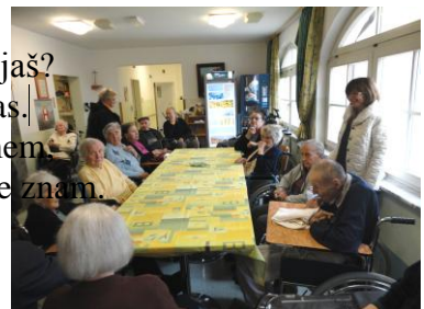
obisk stanovalcev iz doma Talitakum

Tomaž, Tomaž, kam krevljaš? V kozjo vas po par klobas. Če jih snem, domov ne smem če jih komu dam, pa domov ne znam.