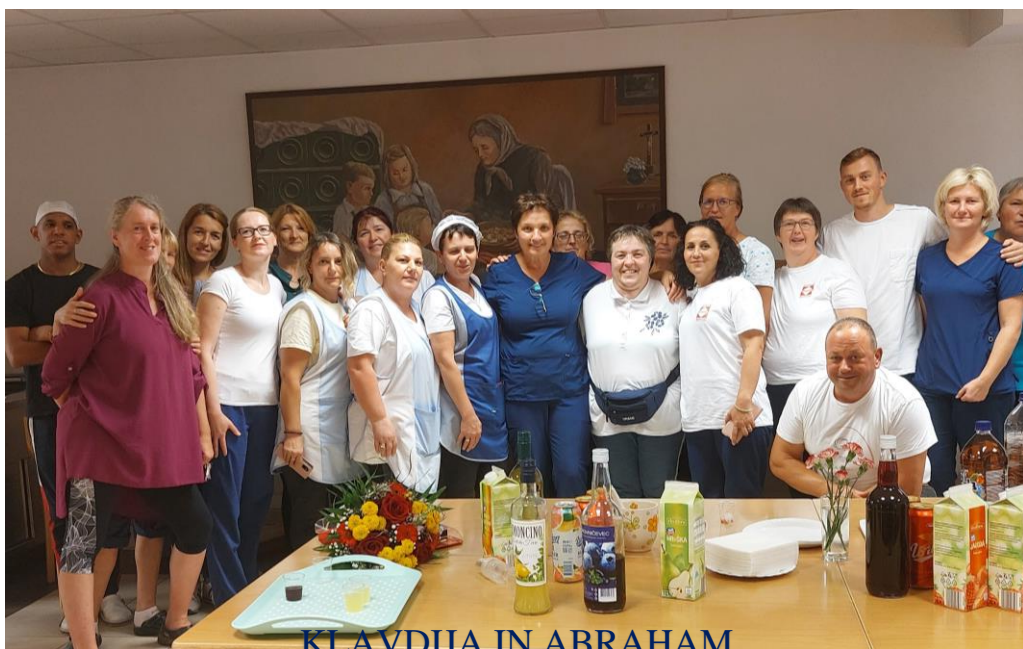
KLAVDIJA IN ABRAHAM