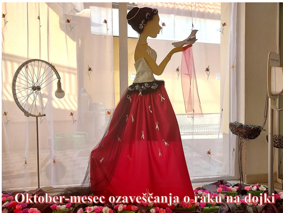
Oktober-meseč ozaveščanja o raku na dojki