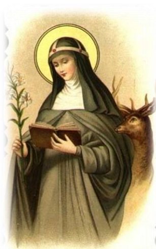
St. Catherine of Sweden.

Čudeži: na čudežen način naj bi rešila mesto Rim pred naraslo Tiberio, ki je že prestopala jezove. Na njenih romanjih naj bi jo večkrat spremljali in varovali svetniki v podobi jelena.