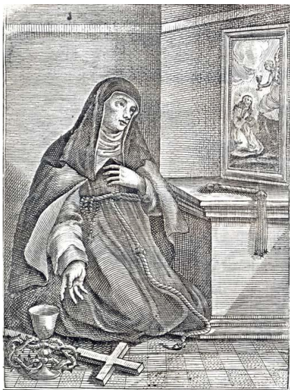
EFFIGIES BEATAE BAPTISTAE, EX PRINCIPIBUS NOBILISS. FAMILIAE DEVARANTIS DE CAMERINO, Ord. S. Clare, quae obiit An. Dom. 1524, 3. Die Junii Nat.