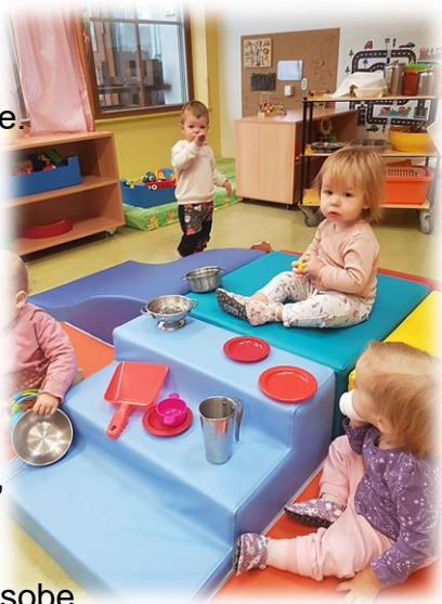
Otroci Rumene sobe

Otroci smo majhni in veseli, Rumeno smo sobo za svojo vzeli. Slovo od staršev bilo je tudi boleče, a da nas je malo v sobi, je tudi nekaj sreče. Plešemo, rišemo, skačemo naokoli, zato nam dolgčas ni nikoli. Poligon nov smo v sobo dobili, da gibalne spretnosti bomo pridobili. Kili kili nam pesmica je poznana, plešemo radi, saj je razigrana. Decembra razveselila nas bo novinka, za njo prišel bo Miklavž izza ovinka. Veseli vsakodnevnih smo novih spoznanj, življenje nam teče hitro vsak dan.